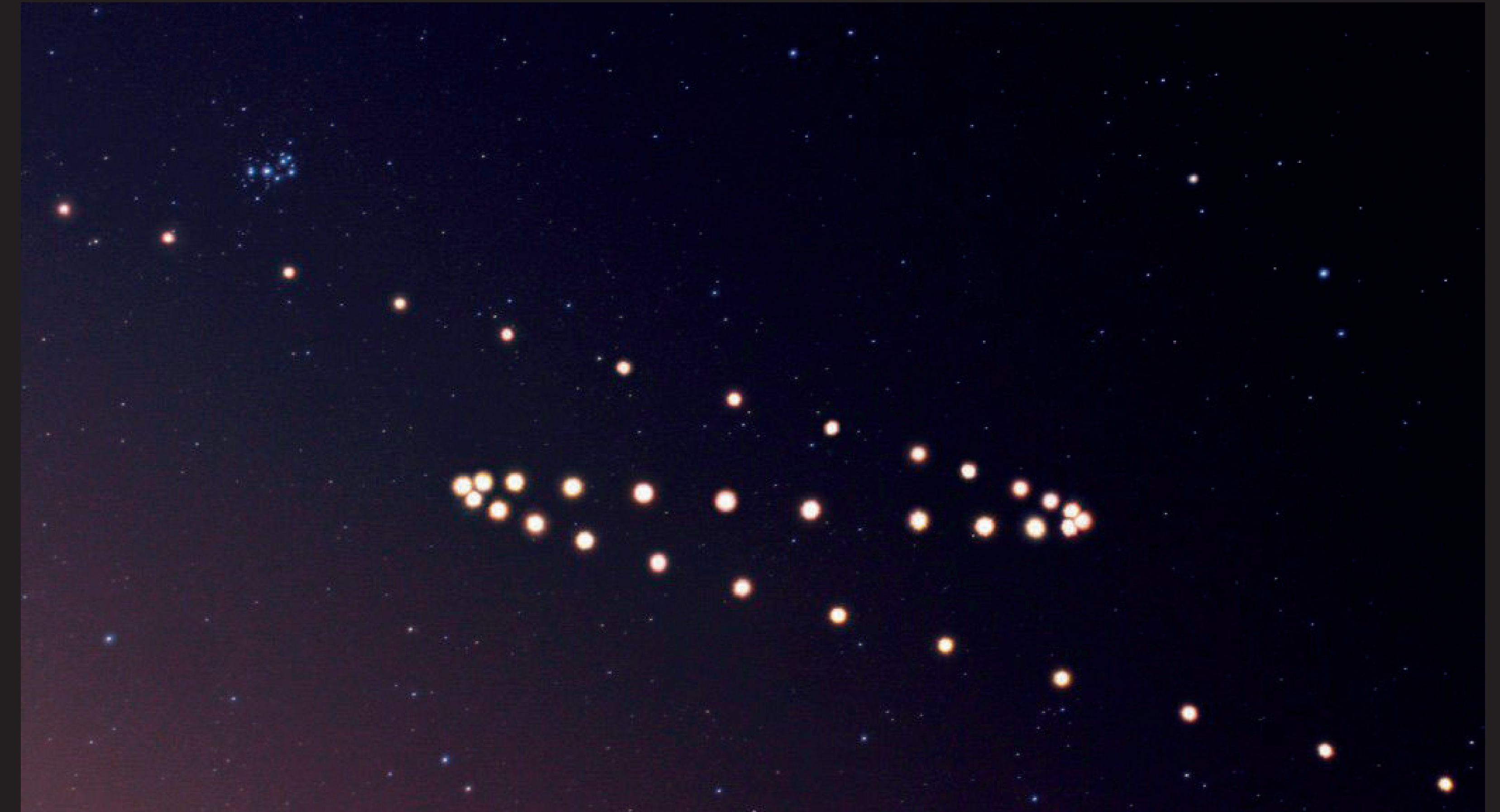
Mouvement de rétrogradation de Mars

Il suffit alors de régler la taille et la vitesse de l'épicycle et du déférent pour retrouver le bon mouvement de rétrogradation de la planète parmi l'ensemble des étoiles.